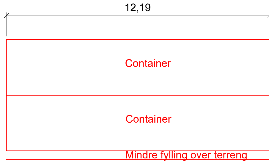
Lengdesnitt, 2 containere, sett fra utsiden av tiltaket